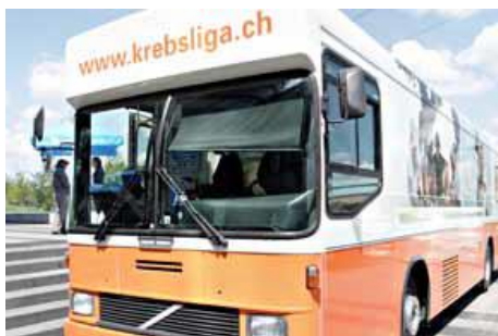
Bus de la prévention