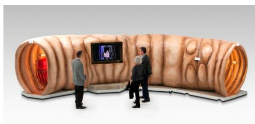
Modèle de l'intestin

Pour certains types de cancer, des mesures de dépistage permettent de détecter à un stade précoce une tumeur ou un état précurseur, si bien que les possibilités de traitement et les chances de survie sont très bonnes.