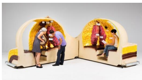
Modèle du sein