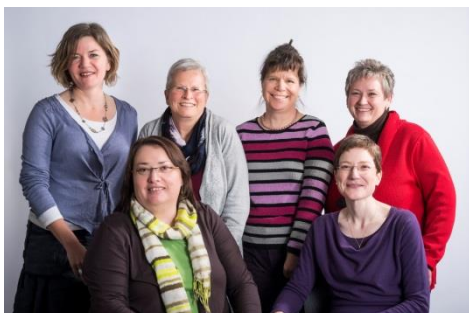
Equipe des conseillères de la Ligne InfoCancer

La Ligue contre le cancer offre un vaste éventail de brochures d'information et de conseil portant sur les thèmes de la prévention, de la maladie, de la thérapie, des séquelles d'une maladie, et de la vie avec le cancer, ainsi que des feuilles d'information sur des thèmes choisis comme l'hormonothérapie/, la mammographie de dépistage, le radon, etc. Il est possible de commander ces brochures - qui existent en plusieurs langues - auprès de la boutique de la Ligue contre le cancer ou auprès des ligues cantonales. On les trouve aussi dans les hôpitaux et les cabinets médicaux. www.liguecancer.ch/boutique , boutique@liguecancer.ch , tél. 0844 85 00 00.