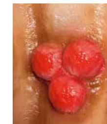
Polype à large base