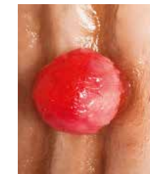
Polype à pédicule court