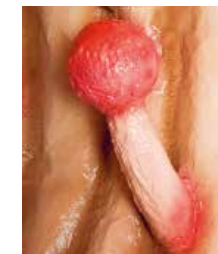
Polype à pédicule long

Le cancer du côlon se développe le plus souvent lentement. Il s'écoule souvent une dizaine d'années avant qu'un adénome ne dégénère en tumeur maligne. Certains polypes, comme les polypes plats, peuvent se transformer plus rapidement en tumeur maligne.